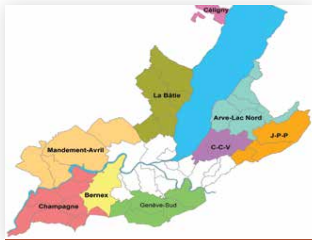
Périmètres des 9 réseaux agro-environnementaux genevois (RAE de la Champagne en rouge)

L'adhésion au projet de la plupart des agriculteurs de la région – 80 % à Avusy – y est pour beaucoup. (Olivier Goy)