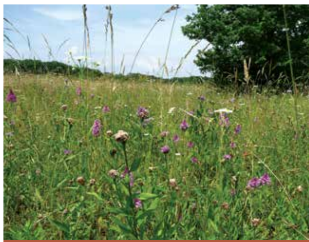
Prairie riche en fleurs travaillée extensivement (fauche au 15 juin)

Ces surfaces sont appelées "surfaces de promotion de la biodiversité" ou SPB.