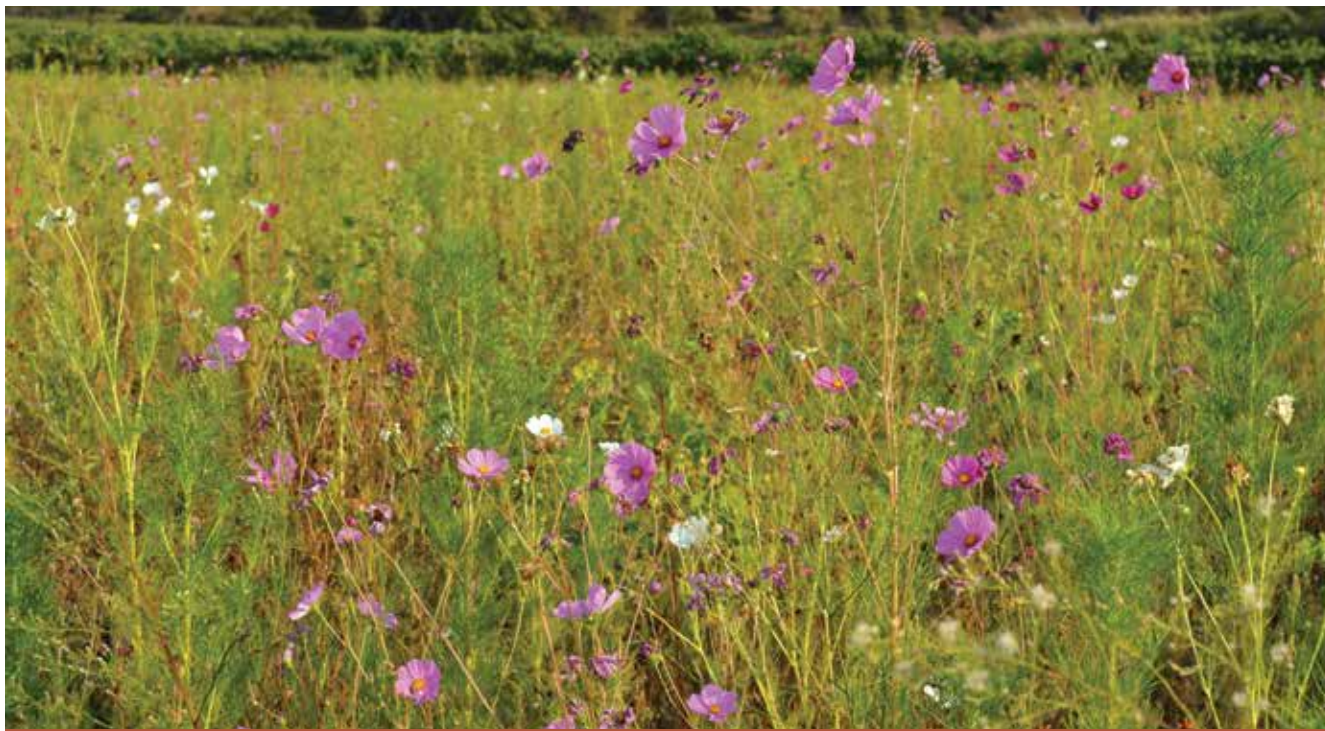
Jachère florale, une surface de promotion de la biodiversité installée dans les terres ouvertes qui est particulièrement favorable aux oiseaux qui nichent au sol.

Vous obtiendrez encore plus de détails en consultant les documents disponibles sous www.ge.ch/paiements-directs/reseaux-agro-environnementaux-rae