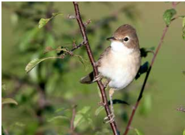
La Fauvette grisette, espèce à favoriser du RAE de la Champagne et dont les effectifs sont en augmentation dans la zone agricole

Le RAE de la Champagne est effectif pour une période de 8 ans (reconductible) soit jusqu'en 2023. Fin 2018, il comptait 37 exploitants et plus de 150 hectares de SPB.