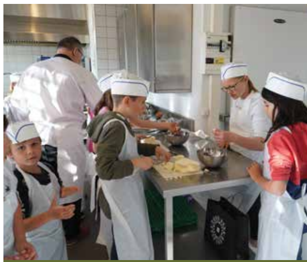
La coupe de mozzarella fait frémir les papilles