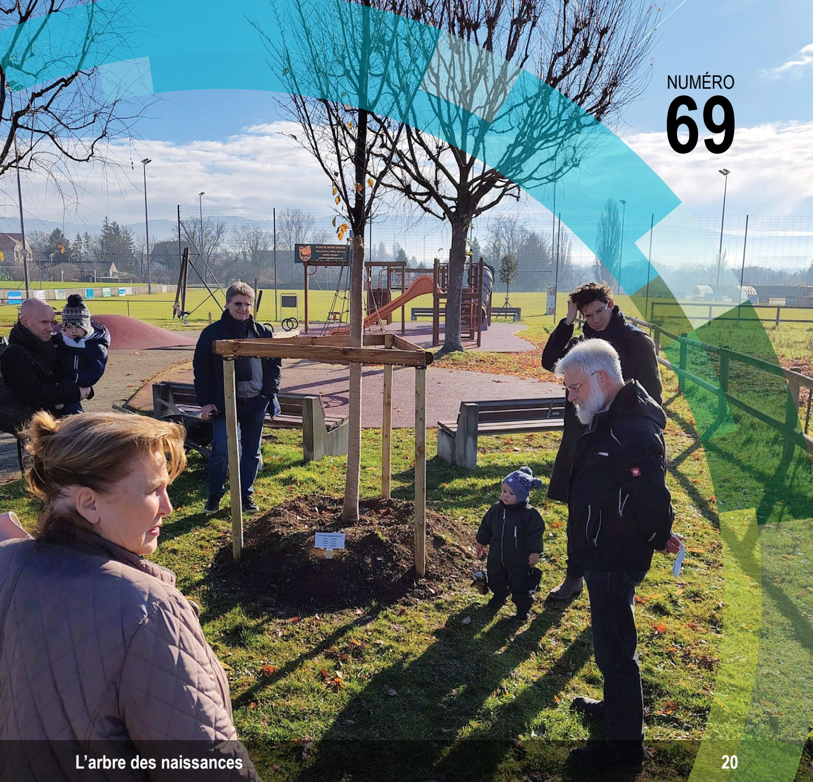
L'arbre des naissances