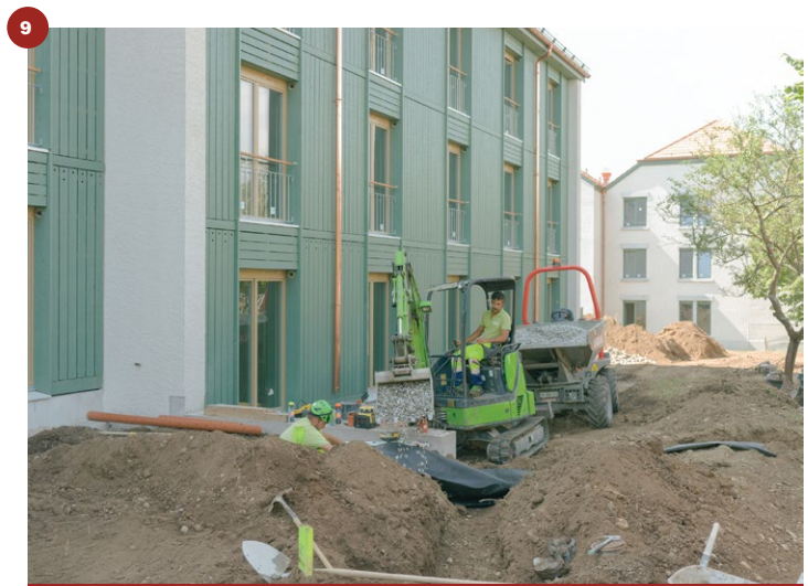
10 Pose du réseau de drains pour infiltrer l'eau dans la noue